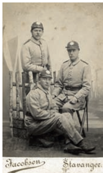
Fig. 7 - 8a- b og 9. Dei tre portretta i visittkortformat viser alle til yrket eller profesjonen til dei avfotograferte. Dei tre mennene til venstre vart fotograferte som soldatar på eksersersplassen Maldesletten tidleg i 1890-åra. Både Carl Jacobsen og andre fotografar hadde i korte periodar gjestatelierer der. Då brukte dei gjerne, som Jacobsen, måla atelierterpe med landskap og militærtelt. Firmalogoen på baksida av fotokartongen var den same som faren brukte i 1870-åra (fig 5b), men Jacobsen-fotografane brukte også andre kartong- og firmalogotypar