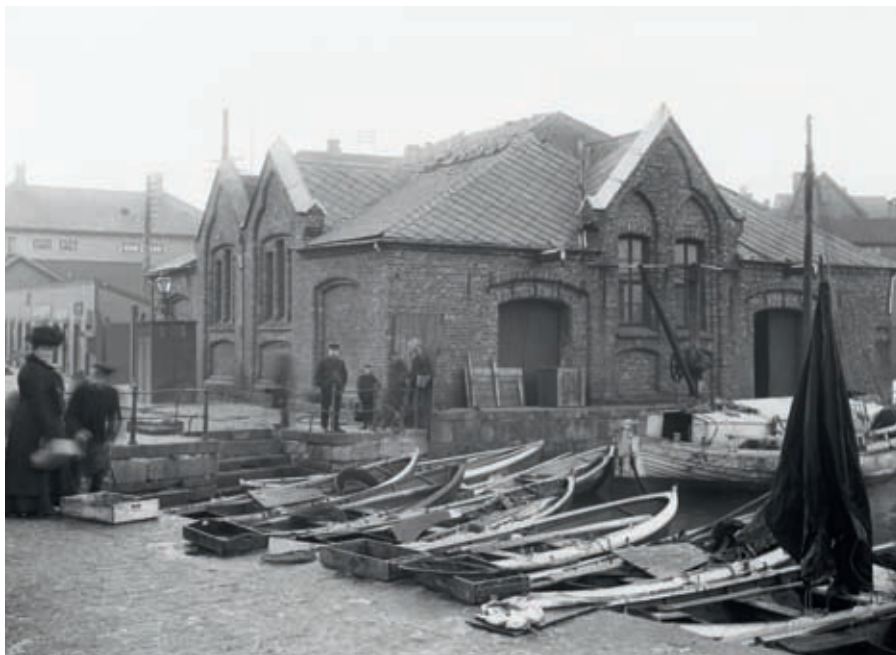
Fig. 14. Dei fleste oppdragsfotografia for Stavanger formannskap viser bygnings-, gate- og hamnemiljø i Stavanger sentrum. Carl Jacobsen fotograferte også i byen før han vart kommunal oppdragsfotograf i 1899. Dette biletet er frå Vågen. Bygningen i bakgrunnen med fleire dører var lagerbygning for alle torghandlarane i byen.

I negativarkivet etter Hakon Johannessen finst det mange motiv frå private heimar frå rundt 1910 – 1920. 31 Det var som oftast borgarskapen som ønskte å dokumentera, eller visa fram bestestovene sine. I den delen av negativarkivet som er bevart etter Carl Jacobsen ved Stavanger byarkiv, dominerer motiv av bygningsmiljø. Vi har likevel ikkje grunnlag for å seia at han ikkje