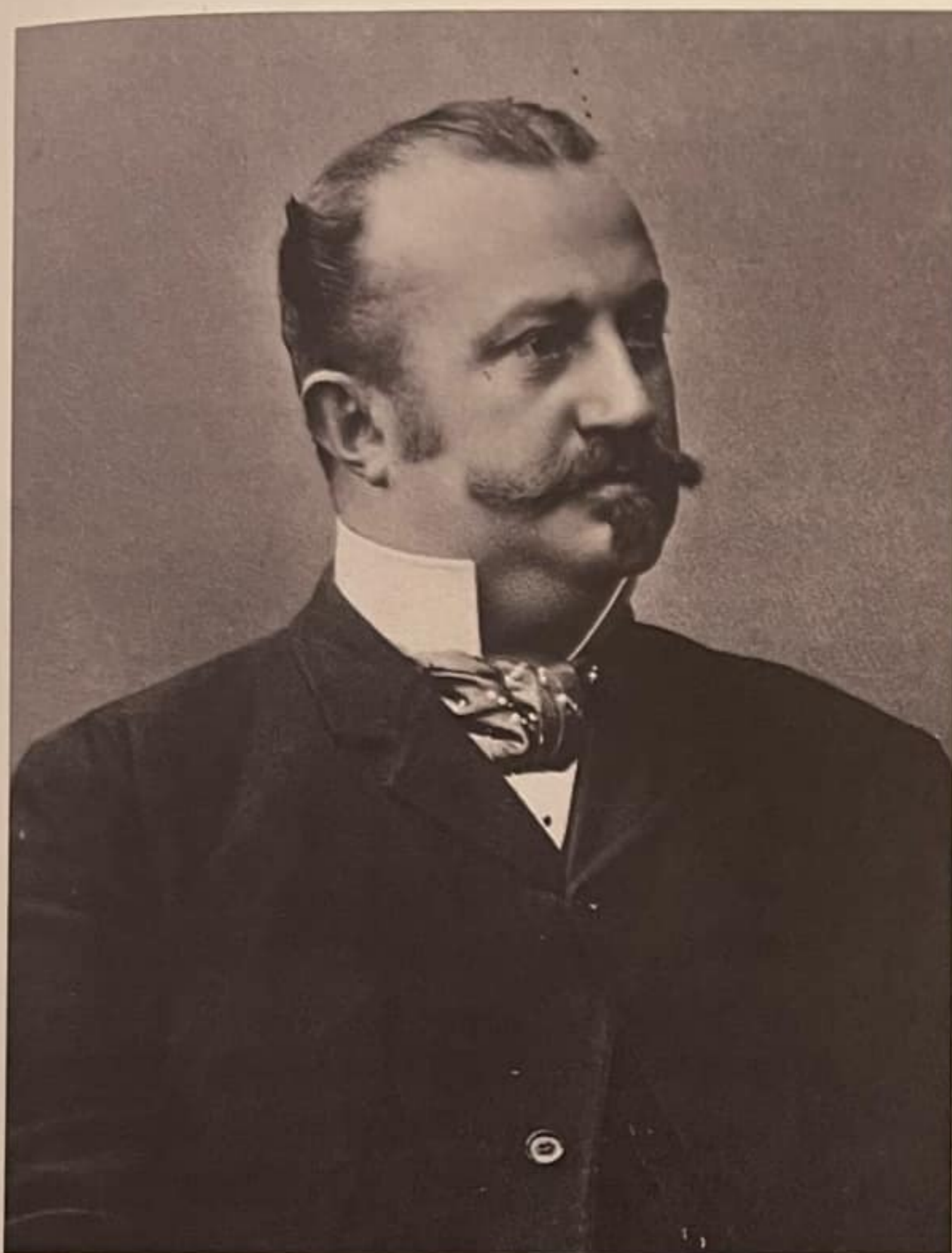
Alexander Kielland (1849-1906)