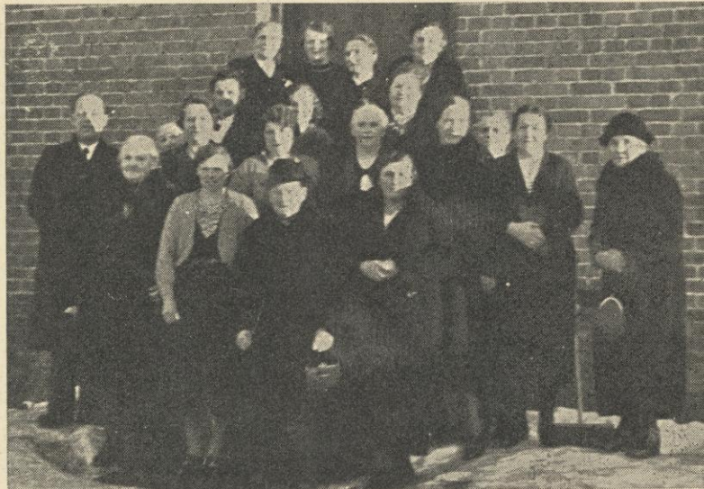
Fossom kvinneforening er 50 år.

Fossom kvinneforening i Østre Bærum hadde i mars sistleden virket i 50 år. — Dagen ble feiret med en fest på Fossom skole søndag 17. mars. Det var møtt fram representanter fra Oslo krets og naboforeninger, bygdas prester var også til stede. Av den oppleste beretning gikk det fram at