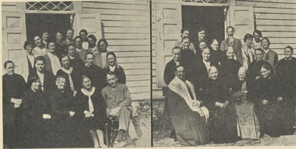
De første avleggerne av Gustava Kiellands forening i Lyngdal. Den delte seg nemlig i to foreninger. Den til venstre, Roms kvinneforening, har sine møter i prestegården. Foreningen til høyre har sine møter i Grøndokka.

«Er der Nogen af Eder, mine Kjære, som kan mindes en af de første Gange vi vare sammen, da vi end-