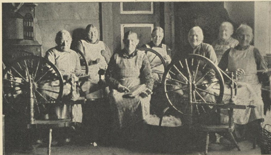
Rokkene surrer fremdeles i Kvarekval kvinneforening på Voss.

Hvor mye av dette som skulle være til misjonærenes bruk får stå hen. Med de skiftende tider gikk en